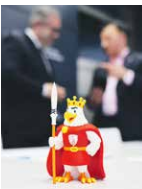
Piastek – trochę orzeł, trochę Chrobry...

Z kolei o rafandynce słyszymy już od tylu lat, że wstyd się przyznawać, ale wciąż, gdy mamy napisać ten wyraz, musimy sprawdzać, czy nie popełniamy błędów... W największym skrócie – to miniaturowy model żaglowca w butelce. A ten konkretny ze zdjęcia jest co dwa lata przekazywany jako symboliczne oddanie przewodnictwa w polsko-niemieckim Partnerstwie Odry.