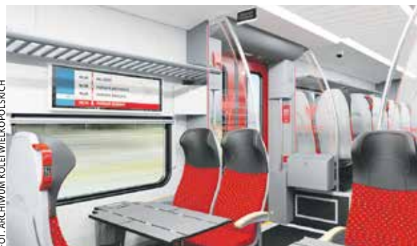
Tak prezentuje się design „flirtów”, które dla Wielkopolski wyprodukuje Stadler.