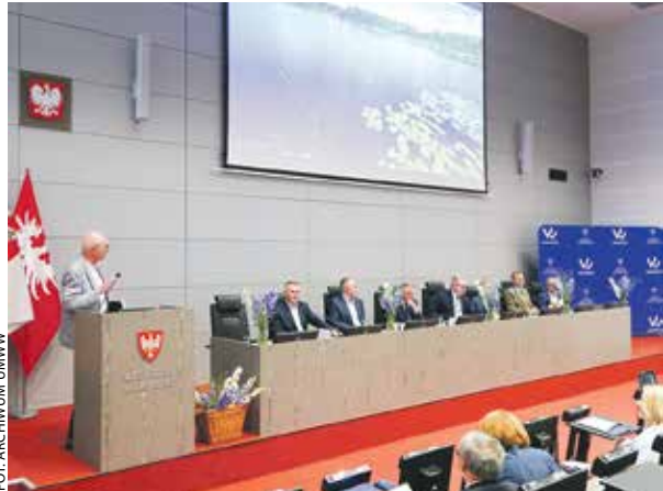
Podczas konferencji w UMWW poruszono różne aspekty dotyczące zarządzania zasobami wodnymi.

Z inicjatywy samorządu województwa w UMWW po raz kolejny rozmawiano o klimacie.