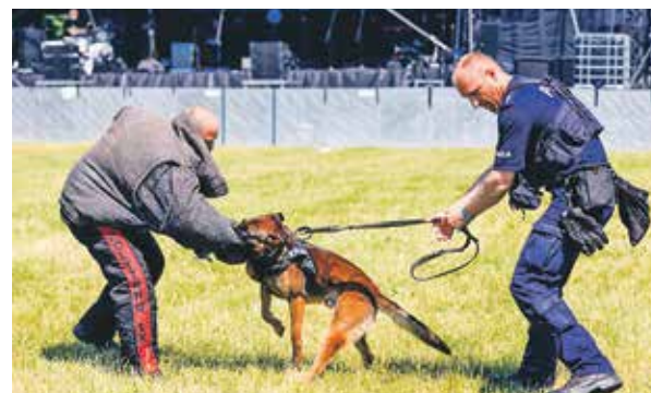
...a także policyjne pokazy.