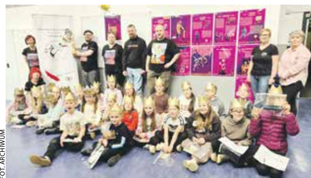
Gnieźnieńscy edukatorzy z przystrojonymi w królewskie korony młodymi uczestnikami zajęć w Edynburgu.

Z kolei w towarzyszących warsztatom spotkaniach wzięło udział około 500 przedstawicieli szkockiej Polonii. ABO