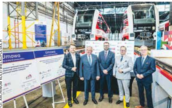
Podpisanie umowy na zakup używanych pojazdów spalinowych, które zasilą linię Poznań – Wągrowiec.