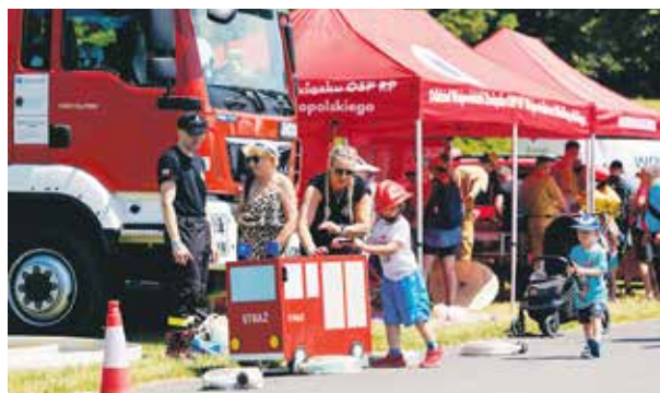
Pojawiły się atrakcje przygotowane przez strażaków...