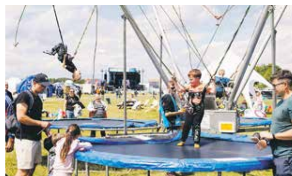
Trampoliny pozwalały poczuć najmłodszym uczestnikom festiwali namiastkę kosmicznej nieważkości.