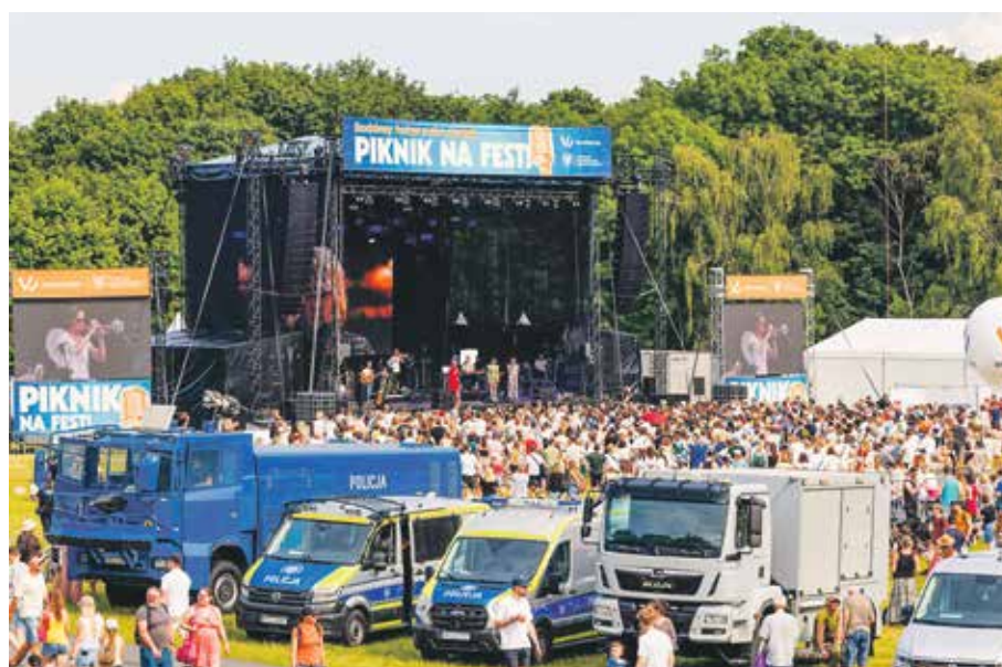
Dla każdego coś miłego na Cytadeli: na pierwszym planie policyjny sprzęt, a w tle – koncert Ani Dąbrowskiej.