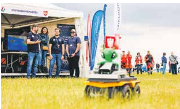
Zainteresowanie wzbudzał prezentowany przez przedstawicieli Politechniki Poznańskiej kosmiczny łażik.