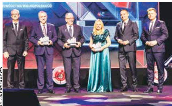
Podziękowania dla zarządu województwa od szefostwa spółki podczas gali 15-lecia Kolei Wielkopolskich.