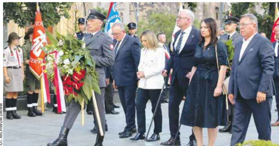
Obchody na Placu Adama Mickiewicza zakończyły się złożeniem kwiatów przed Pomnikiem Poznańskiego Czerwca '56.

Tam między innymi prezydenci Polski, Albanii, Łotwy i Węgier podpisali oświadczenie, podkreślające wagę wydarzeń Czerwca 1956 r. Podczas swojego wystąpienia prezydent Karol Nawrocki zapowiedział inicjatywę ustawodawczą, której celem ma być ustanowienie 28 czerwca nowego święta państwowego – Dnia Działacza Opozycji Antyko-