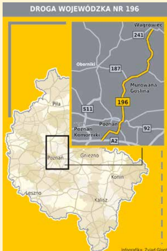
Infografika: Zviad Glonti