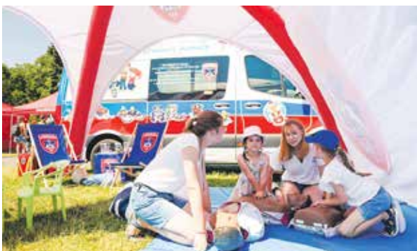
...warsztaty z udzielania pierwszej pomocy...