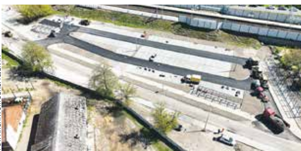
Punkt przesiadkowy w Starych Oborzyskach.

W Starych Oborzyskach, oprócz 140 miejsc parkingowych dla aut i rowerów, powstały przystanek autobusowy, droga rowerowa i chodniki. Nie