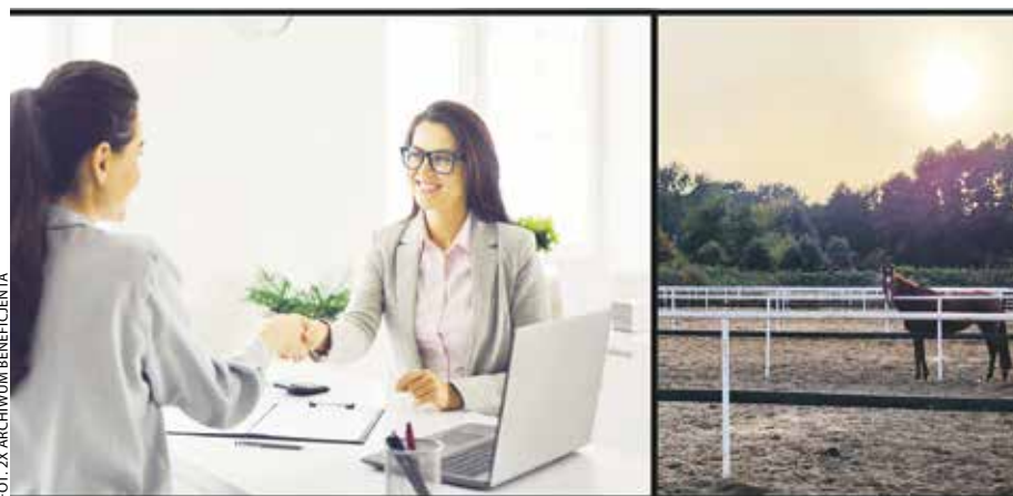
W regionie można skorzystać z sześciu pożyczek.

Właściciele firm z Wielkopolski mogą korzystać z „Pożyczki