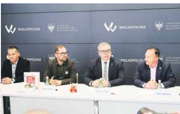
O tegorocznych atrakcjach poinformowano podczas konferencji prasowej w UMWW.

Co przygotowano dla turystów w ramach tegorocznej odsłony „Weekendu na Szlaku Piastowskim”?