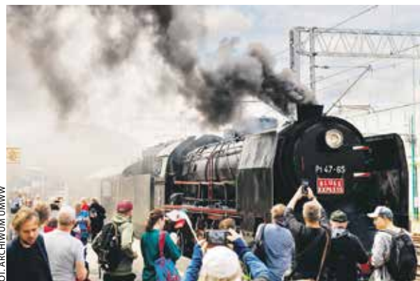
Blues Express po raz kolejny mógł wyruszyć w trasę dzięki wsparciu samorządu województwa.