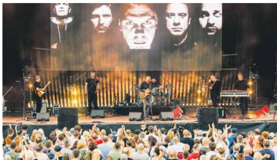
...jak i zespół Raz Dwa Trzy.