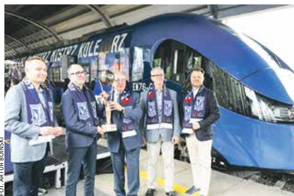
Zaprezentowanego 9 czerwca „elfa” w barwach „Lecha” można spotkać na różnych wielkopolskich trasach.