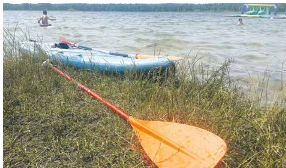
Od kilku lat popularność wśród wodniaków zyskują również deski SUP.