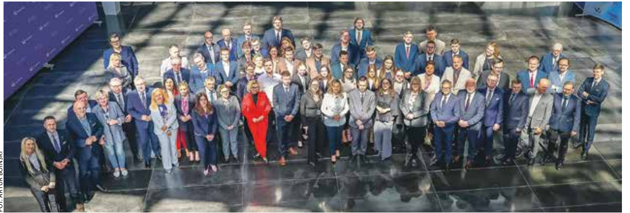
FOT. ARTUR BOJNSKI

Podsumowano I kadencję Młodzieżowego Sejmiku Województwa Wielkopolskiego, a wkrótce swoją pracę rozpoczną nowo wybrani radni.