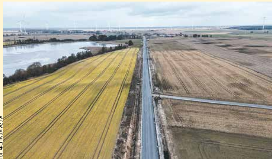
II etap rozbudowy drogi na odcinku Margonin – Durowo.

Droga wojewódzka nr 190 ma około 105 km, a więc należy do rekordowo długich takich tras w Wielkopolsce. Przecina niemal całą północną część naszego regionu.