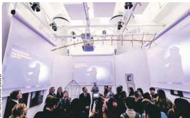
Dzięki renowacji Konin zyskał obiekt, który może spełniać wiele funkcji kulturalnych.