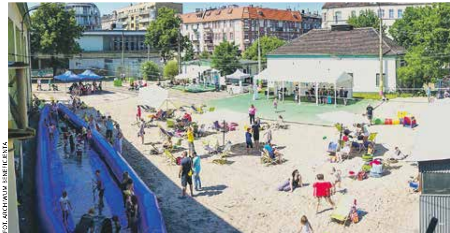
Nieczynna zajezdnia stanie się plenerowym centrum kulturalno-społecznym.

Po rewitalizacji ma zostać przekształcony w nowoczesne centrum kulturalno-społeczne. W ramach inwestycji planowana jest rozbudowa hali wozowni i budynku socjalno-magazynowego, a także wzniesienie nowego obiektu