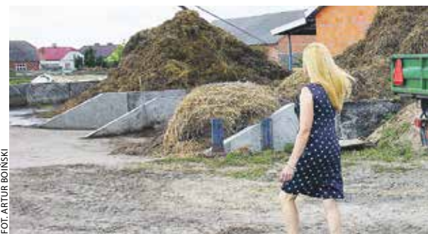
Prace polowe i produkcja zwierzęca to nieodłączny element życia na wsi.