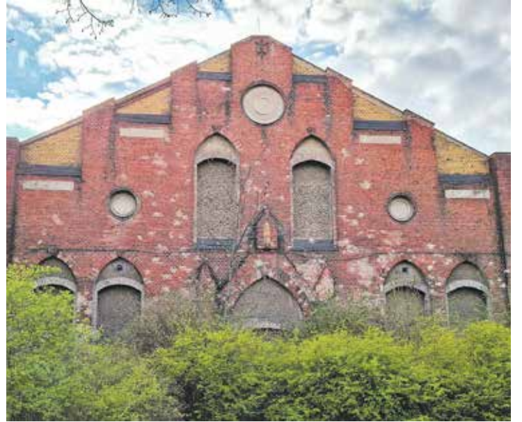
W tym budynku, u zbiegu obecnych ulic Bukowskiej i Grunwaldzkiej, mieściła się w 1895 roku pierwsza poznańska elektrownia.