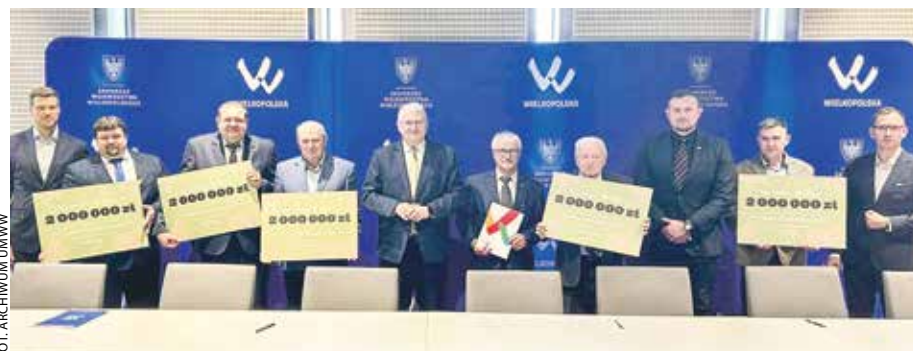
Umowę z przedstawicielami pszczelarzy podpisał wicemarszałek Krzysztof Grabowski.

Samorząd województwa przeznaczy w 2026 roku 2 miliony złotych na realizację programu „Wielkopolska wspiera pszczoły”.