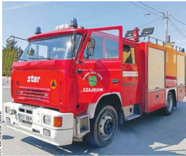
Star wycofany z Czajkowa powinien jeszcze przez wiele lat służyć mołdawskim strażakom.

Już jedenasty samochód pożarniczy trafił z Wielkopolski do Mołdawii. Przekazała go OSP z Czajkowa.