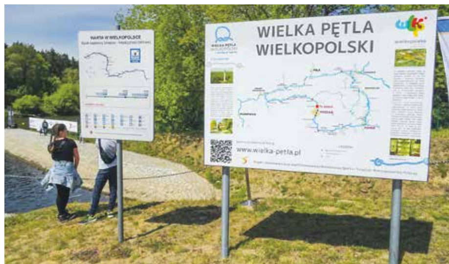
Szlak WPW oplata niemal całe województwo i zahacza o sąsiednie regiony.

– Rejs łodzią lub spływ kajakiem to zupełnie inny sposób zwiedzania niż jazda au-