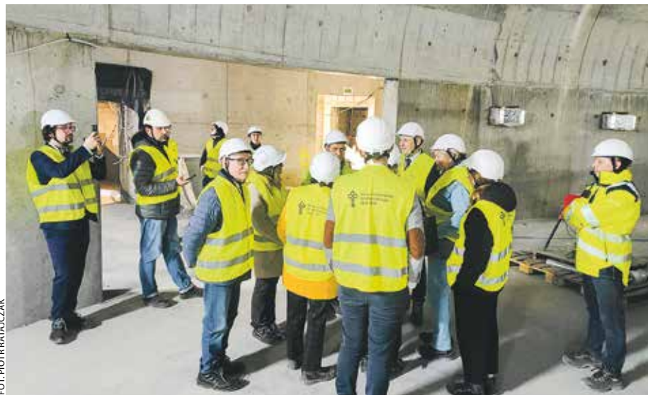
Radni, muzealnicy i budowlancy obejrzeni 14 kwietnia, po posiedzeniu sejmikowej Komisji Kultury, imponujący plac budowy muzeum.

Ministerstwo Kultury i Dziedzictwa Narodowego zaplanowało na ten cel 222 mln zł, natomiast samorząd województwa 156 mln zł. Obecnie kolejne gminy i powiaty podejmują uchwały o przekazaniu funduszy do regionalnego budżetu. Radni sejmiku wprowadzają te kwoty do kasy SWW (także pod-