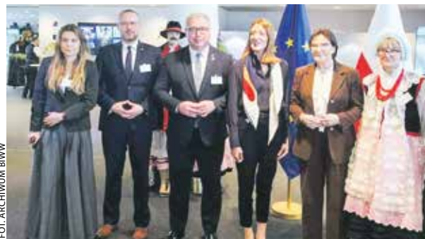
FOT. ARCHIWUM BIWW

Pałuki zaprezentowały się w europarlamencie.