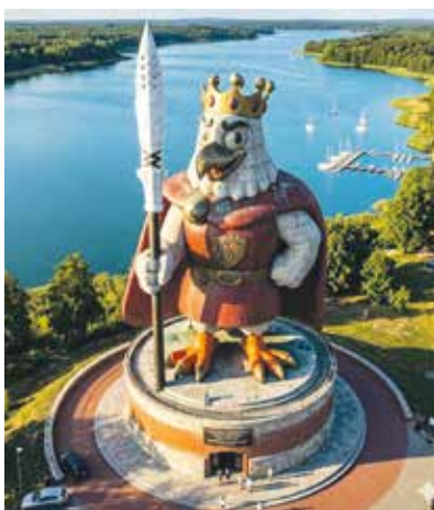
Co stanie nad Jeziorem Powidzkim?