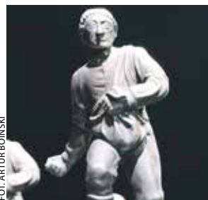
Do kogo tym razem trafi statuetka siewcy?

Zgodnie z regulaminem, mogą w nim uczestniczyć rolnicy, którzy prowadzą swoje gospodarstwo od co najmniej