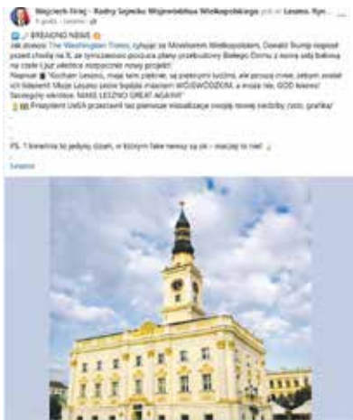
Donald Trump zwrócił wzrok na Leszno.

W okolicach 1 kwietnia przejrzałem facebookowe profile sejmikowych radnych, polując na najlepsze primaprilisowe żarty. Naszym – oczywiście subiektywnym – zdaniem na wyróżnienie zasłużyły trzy wpisy.