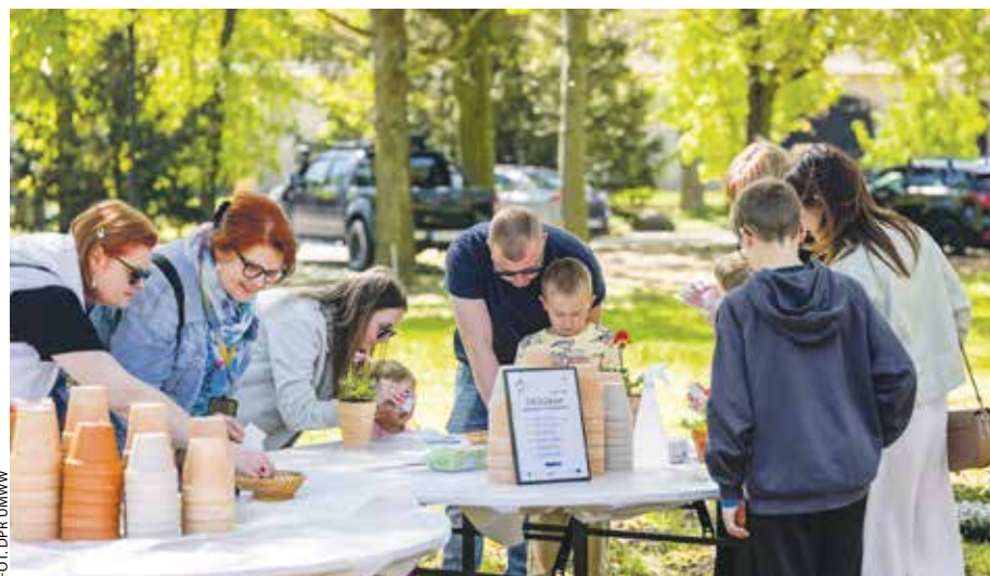
Za nami „Majówka z Funduszami” w Rokosowie, która przyciągnęła rodziny.

Za nami pierwsze wydarzenia. 1 maja odbyła się „Majówka z Funduszami” na zamku w Rokosowie. Na rodziny czekały kreatywne warsztaty rzemiosła, questy po parku oraz spektakle Teatry-