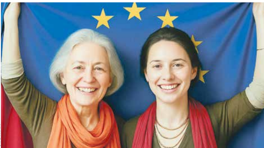
82 proc. Polaków popiera członkostwo Polski w UE (Źródło: CBOS, 2026).

Tyle o liczbach. Znacznie istotniejszy jest postęp cywilizacyjny, społeczny, infrastrukturalny, który dokonywał się na naszych oczach. Dwie dekady temu Wielkopolska – po-