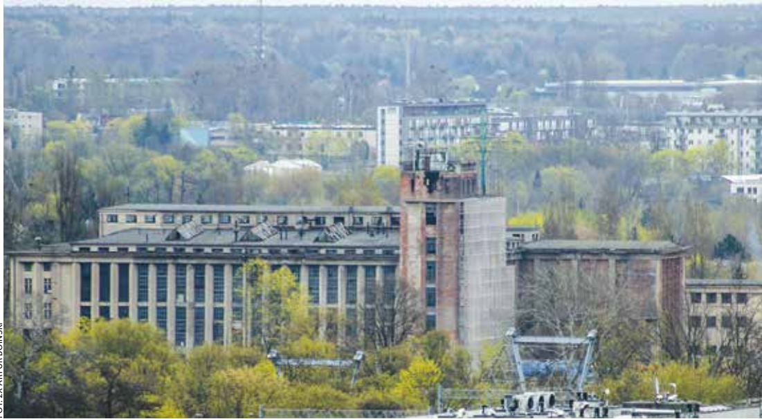
Dokładnie przed wiekiem, zaledwie w ciągu dwóch lat, powstał potężny gmach elektrowni Garbary, o charakterystycznej sylwetce, zaprojektowany przez Stefana Cybichowskiego.

Skąd przez lata stolica regionu pozyskiwała energię elektryczną?