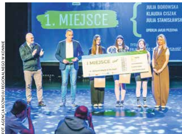
Na zdjęciu zwycięskie uczennice ze szkoły w Żychlinie.

Była to już druga edycja konkursu „Kamera! Akcja! Transformacja! Kręcimy lepsze jutro”. Wpłynęły aż 24 autorskie prace filmowe, które analizowało 4-osobowe jury pod przewodnictwem filmowca Andrzeja Mosia. Eksperti oceniali filmy w sposób całkowicie anonimowy, biorąc pod uwagę przede wszystkim kreatywność autorów, jakość